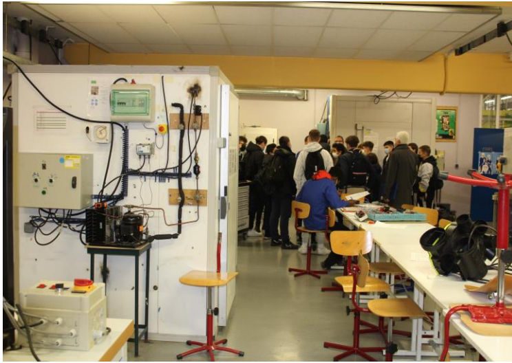
Les collégiens découvrent les installations frigorifiques (Installation et dépannage de chambres froides notamment)