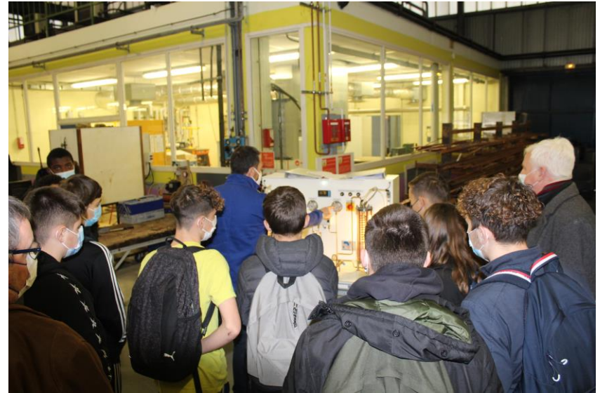
Comment fait-on du froid ? (explications devant un système pédagogique)