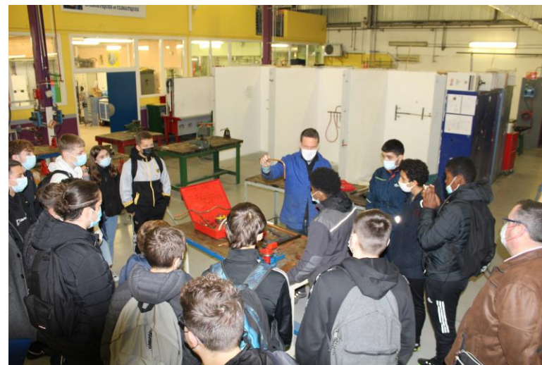
Le résultat du cintrage d'un tube de cuivre réalisé par un collégien après démonstration d'un élève de seconde