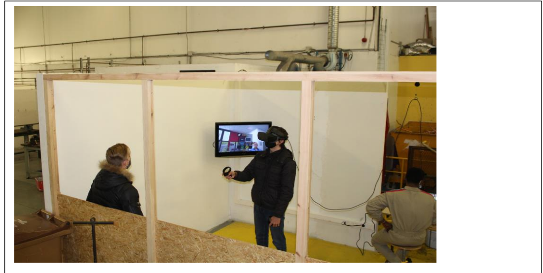
Un élève de troisième s'essaie à la réalité virtuelle utilisée au lycée Guynemer pour l'habilitation électrique ou pour l'entraînement à la manipulation des fluides frigorigènes (en parallèle des manipulations sur installations réelles)