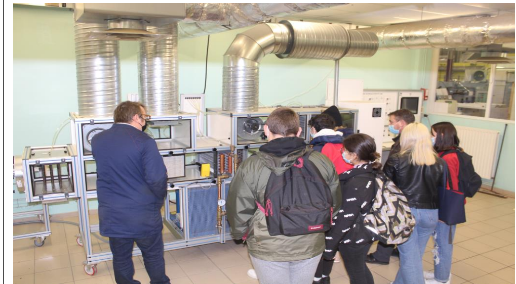
Explications sur une centrale de traitement de l'air